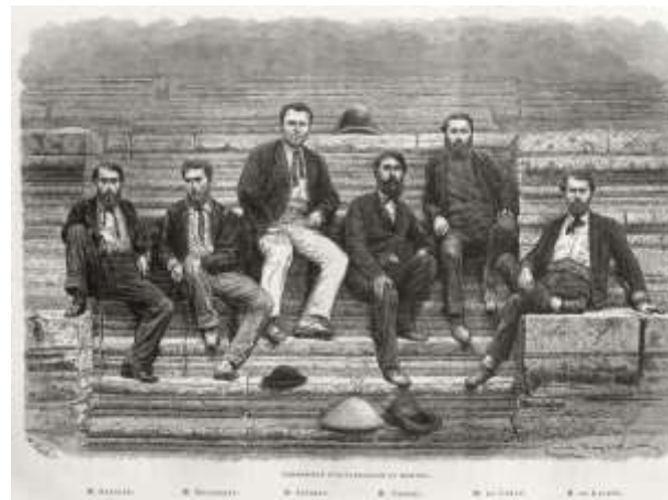
De leiders van de expeditie in Angkor

Op 5 juni 1866 verliet het ongeveer twintigkoppige gezelschap Saigon in twee kleine stoomboten, zwaar beladen met voedsel, wapens, wetenschappelijke instrumenten en ... ongeveer duizend liter sterke drank. Eerste halte werd Angkor, dat pas vijf jaar voordien bekend geraakte door toedoen van Henri Mouhot. Enkele dagen na hun bezoek aan de overwoekerde tempelstad moesten de reizigers de stoomboten vervangen door ter plaatse gemaakte prauwen en volgde de eerste ontgoocheling op de grens tussen Cambodja en Laos, waar de watervallen van