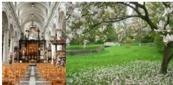
Kerk en tuin van het Karmelietenklooster

Na het middageten verkennen we de pittoreske wijk van het Prinsenhof en brengen we o.a. een bezoek aan het Karmelietenklooster in de Burgstraat. We bezichtigen de mooie barokkerk, die in 1714 werd ingewijd, en de verrassend grote kloostertuin met de zogenaamde leeuwenkooi van Keizer Karel. Ook nemen we een kijkje in de bibliotheek, de grafkelder en de pandgang.