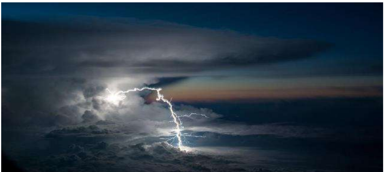
Onweer boven Ecuador