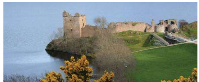
Inverness - Fort William