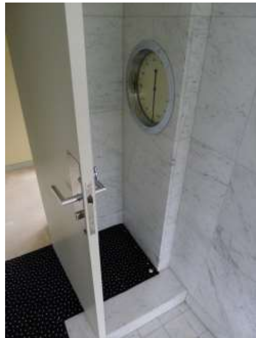
Villa Cavrois weegschaal

nodigde als het ware daklozen en drugdealers uit om van het gebouw één grote ruïne te maken. Pas in 2001 kocht de Franse staat de villa aan en dan duurde het nog eens tien jaar voordat de restauratie begon. Maar die is dan ook helemaal geslaagd.