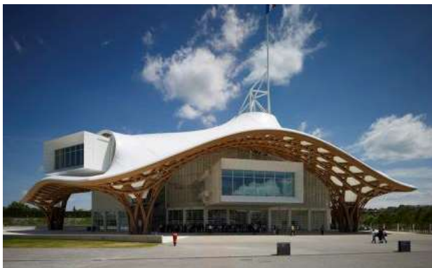
Metz - Centre Pompidou

Op onze eerste dag trekken we naar Metz, de hoofdstad van de regio Lorraine en van het departement Moselle. Op het programma van die dag staat een bezoek aan de kathedraal Saint-Étienne , één van de mooiste kerken van Frankrijk. Ze heeft haar bijnaam “ la lanterne du bon Dieu ” gekregen dankzij de schitterende glasramen, die zorgen voor een caleidoscopisch lichtgordijn en die dateren van de dertiende tot de twintigste eeuw.