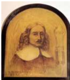
Schilderij van Jan Palfyn, de uitvinder van de verlostang, in het Museum voor de geschiedenis van de geneeskunde.

’s Middags genieten we van een lunch in de onmiddellijke buurt van het Pand.