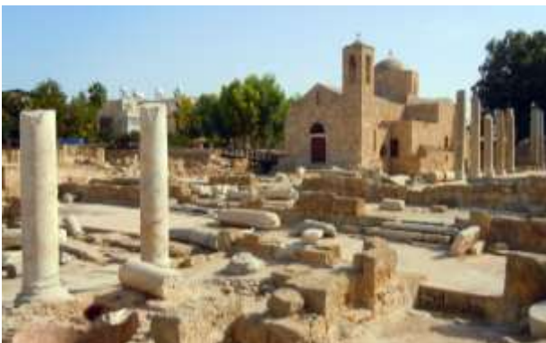
AgiaKyriaki, Hrysopolitissa Basiliek, Paphos, Cyprus

Paphos, waar de zon altijd schijnt en het leven zoet is.