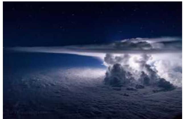
Bliksemschicht boven zee

Plots klinkt er muziek. In één van de bootjes zit een sopraan die met luide en klare stem een lied zingt, bijna als een soort houvast om de paniek te verdringen.