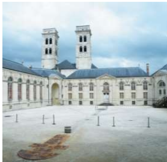
Verdun, Bisschoppelijk Paleis

Na het ontbijt rijden we naar Verdun, de stad die zwaar is getekend door de gruwel van de Eerste Wereldoorlog. Nog voor de lunch bezoeken we de Citadelle Souterraine ; de kathedraal en; in het vroegere Palais Episcopal , het Centre Mondial de la Paix . Na de lunch houden we halt in het Ossuaire de Douaumont , de necropool waar de niet-geïdentificeerde resten van ongeveer 130.000 Franse en Duitse soldaten een laatste rustplaats hebben gekregen. Daarna rijden we huiswaarts. Vermoedelijke aankomst: 19.00 uur.