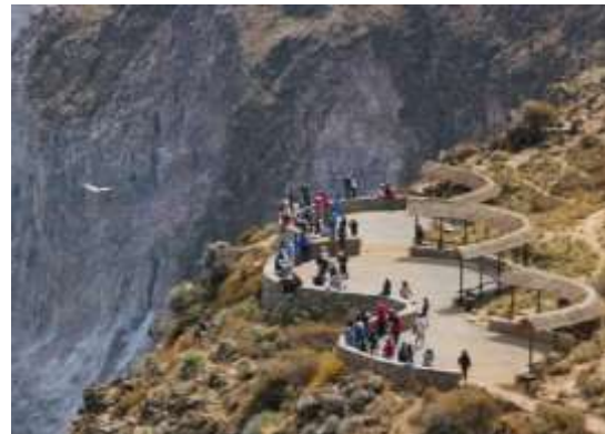
De Colca -Canyon

We wachtten een tijdje. De canyon is een